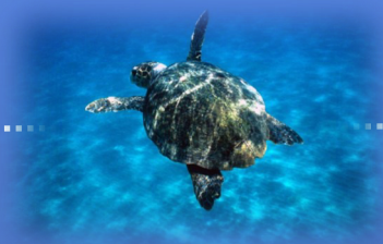
"Costa dei Gelsomini"