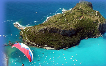
"Riviera dei Cedri"