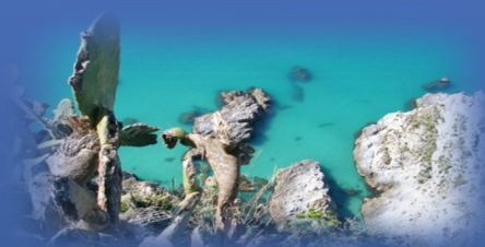
"Fondali Capocozzo, S. Irene, Vibo Marina, Pizzo, Capo Vaticano, Tropea"....