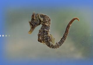
"Baia di Soverato"

(art. 9, comma 9, Legge Regionale n. 24 del 16 maggio 2013)